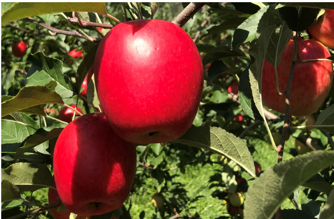
Cultivar SCS1605 Serrana