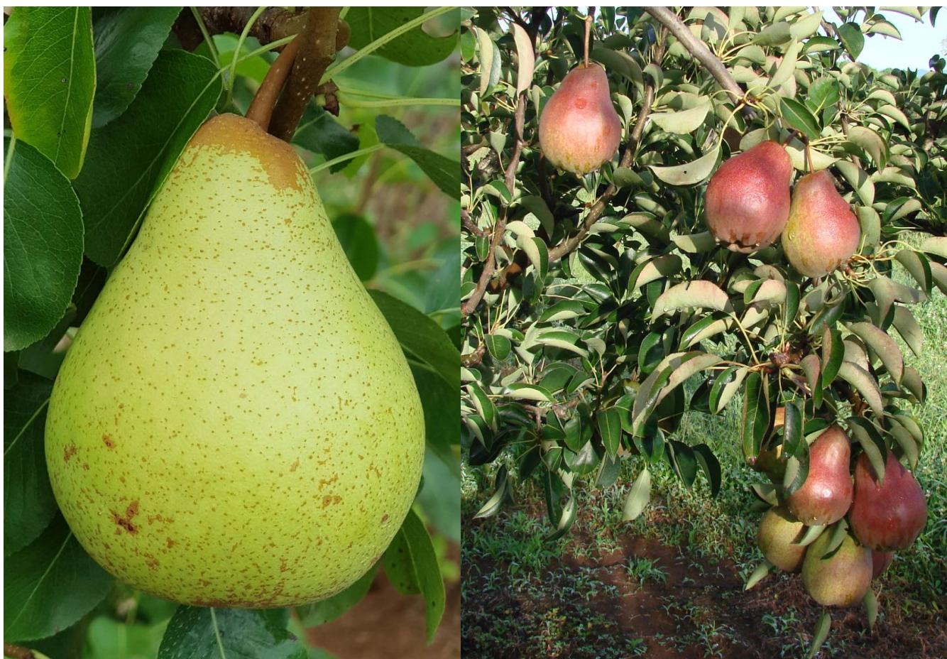
Frutos do cv. Rocha (esquerda) e Max Red Bartlett