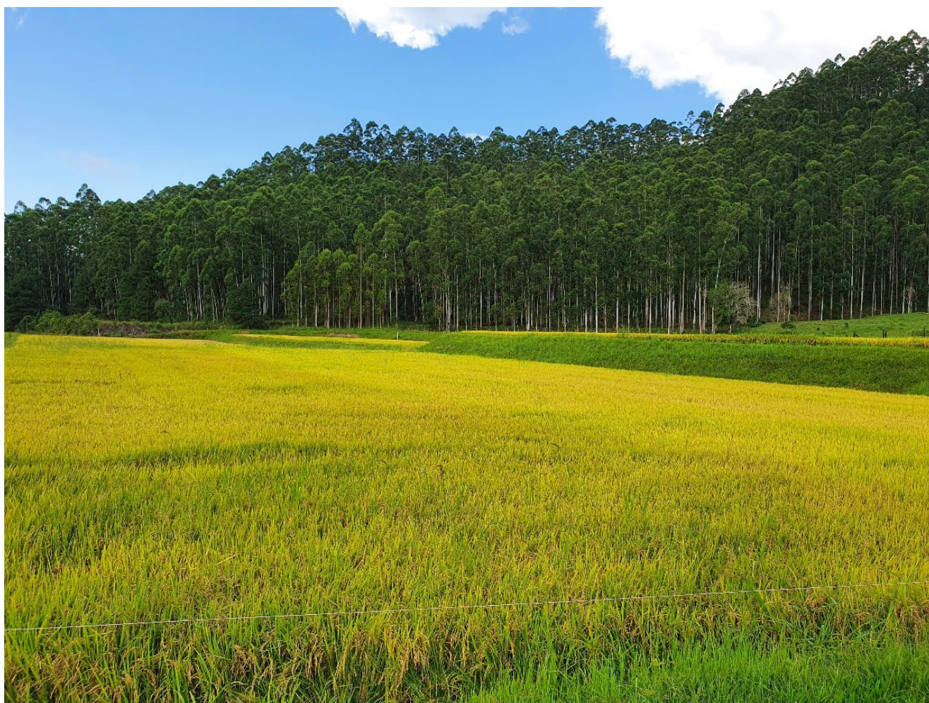
Unidade de observação do cultivar SCSBRS126 Dueto em Rio do Campo, SC (safra 2022/2023)