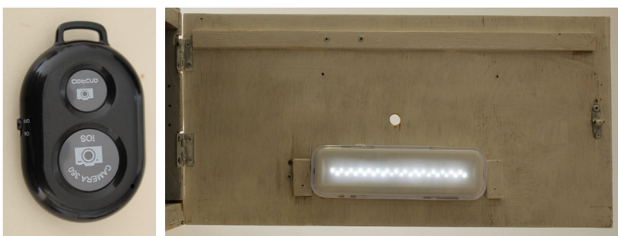
Figura 4. Acionador Bluetooth para disparo da câmera do celular (a) e luminária para iluminação da câmara de aquisição de imagens digitais (b) Figure 4. Bluetooth trigger for triggering the cell phone camera (a) and luminaire for lighting the digital image acquisition camera (b)

A câmara foi testada nos apiários das Estações Experimentais da Epagri em Videira e em Caçador. Foram tomadas imagens de 80 favos de crias de ambas as faces totalizando 160 imagens. O tempo médio decorrido para cada colmeia (ou seja, dez favos da cada colmeia) foi de 12,4 minutos. Na utilização da câmara a campo verificou-se grande praticidade e eficiência, permitindo a captura das imagens de ambos os lados dos 10 quadros de ninho da colmeia em um período de tempo menor que aquele tradicional, utilizando-se folhas de acetato transparentes (Tabela 1).