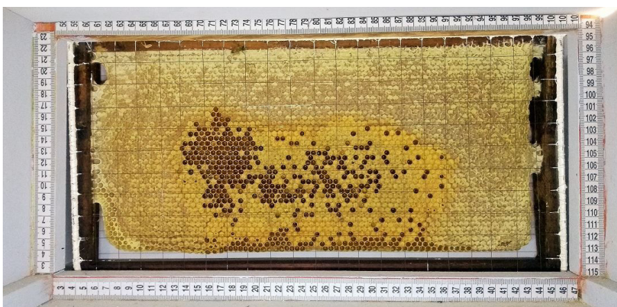
Figura 3. Vista interna da câmara onde pode se observar a fita graduada nos eixos "x" e "y" utilizada como escala e a imagem de um quadro do ninho com favo com a tela de arame quadriculada 2X2cm Figure 3. Internal view of the chamber where the tape graduated in the "x" and "y" axes can be seen, used as a scale and the image of a frame of the nest with a 2X2cm checkered wire mesh