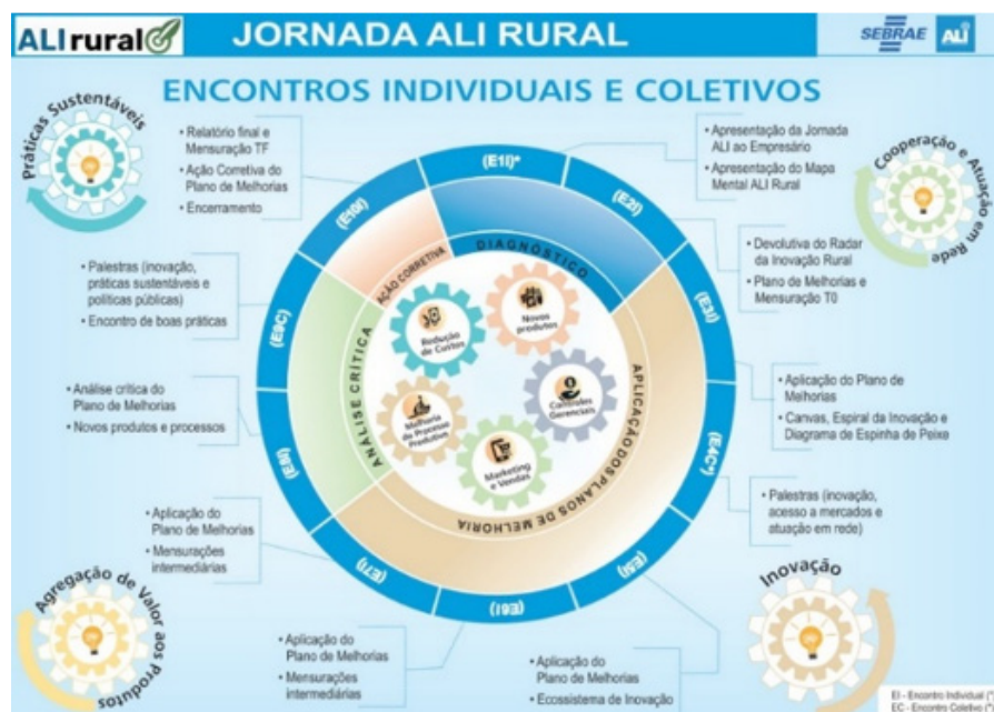
Figura 1. Atividades da Jornada de Inovação Rural, organizadas em 10 encontros (8 individuais e 2 coletivos) com ciclos de 8 meses