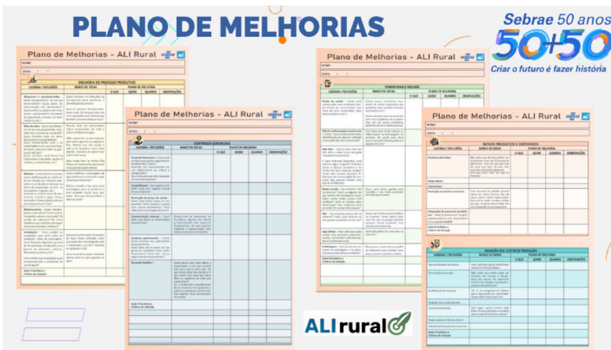
Figura 2. Exemplos dos planos de melhoria utilizados na Jornada de Inovação Rural Figure 2. Examples of improvement plans used in the Rural Innovation Journey

Observaram-se avanços nos indicadores em todas as dimensões, sendo que o valor médio do grau de inovação nos empreendimentos catarinenses passou de 2,3 (T zero) para 2,8 (T final) (Figura 3). Na média nacional do indicador radar de inovação, também houve melhora entre o cenário inicial encontrado (T zero = 1,9) e após a implementação do plano de ações (T final = 2,4).