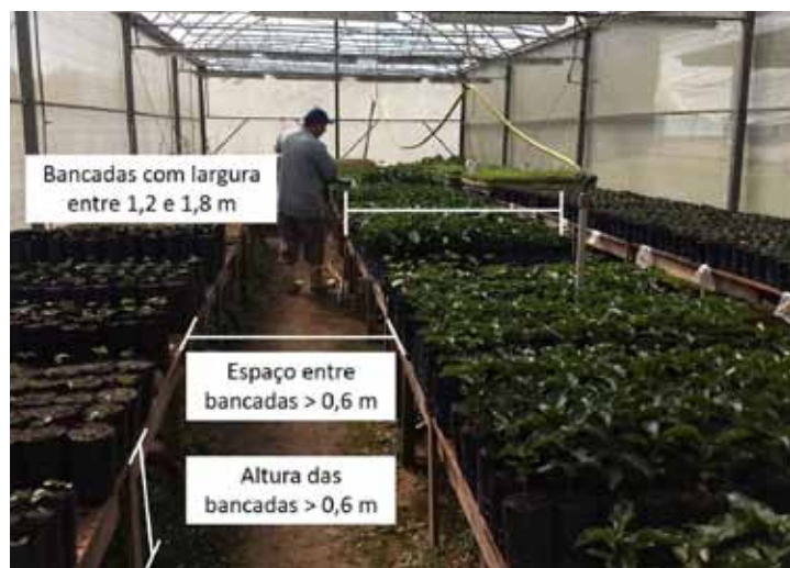
Figura 2. Produção de mudas sobre bancadas facilita o manejo das mudas e proporciona melhor ergonomia ao trabalhador.

NARITA, N.; YUKI, V.A.; NARITA, H.H.; HIRATA, A.C.S. Maracujá amarelo: tecnologia visando a convivência com o vírus do endurecimento dos frutos. Pesquisa & Tecnologia , v.9, n.1, 2012.