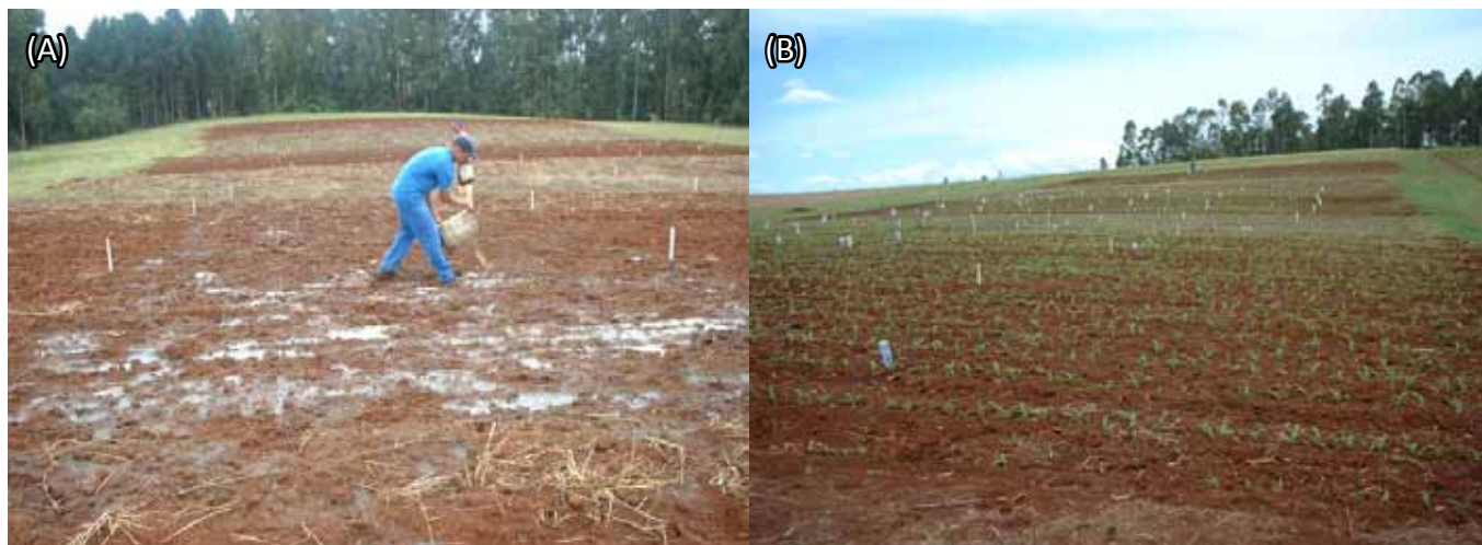
Figura 1. (A) Aplicação de dejetos líquidos de suínos e (B) vista geral do experimento após a aplicação dos tratamentos de manejo do solo e emergência da cultura de milho

Realizou-se análise da variância considerando o delineamento em faixas (Zimmermann, 2004), e as camadas como subparcelas. Quando constatada diferença significativa entre fontes de variação pelo teste F, as médias foram comparadas pelo teste de Tukey ( p < 0,05 ). Quando constatadas interações