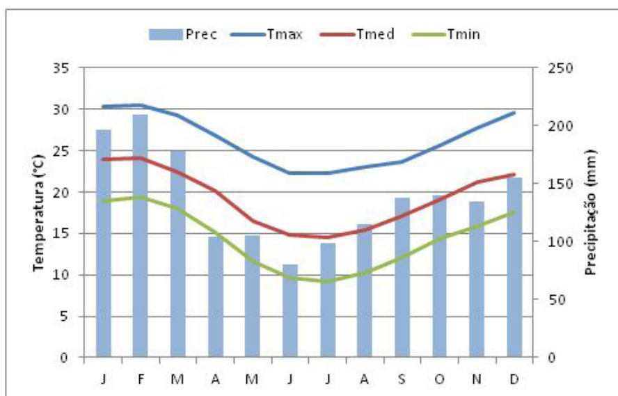
Figura 1. Normais de temperaturas médias, máximas e mínimas e precipitação mensal da Estação Meteorológica de Urussanga, SC

O trabalho foi conduzido na Epagri/ Estação Experimental de Urussanga, localizada no município de Urussanga (latitude 28°31'S, longitude 49°19'W, altitude 49m). O clima da região, segundo classificação de Köppen, é do tipo Cfa (Mesotérmico, sem estação seca definida e com verão quente). A temperatura média anual é de 19,3°C, e a precipitação pluviométrica é de 1.600mm. A Figura 1 mostra a distribuição das temperaturas médias, máximas e mínimas bem como da precipitação ao longo do ano.