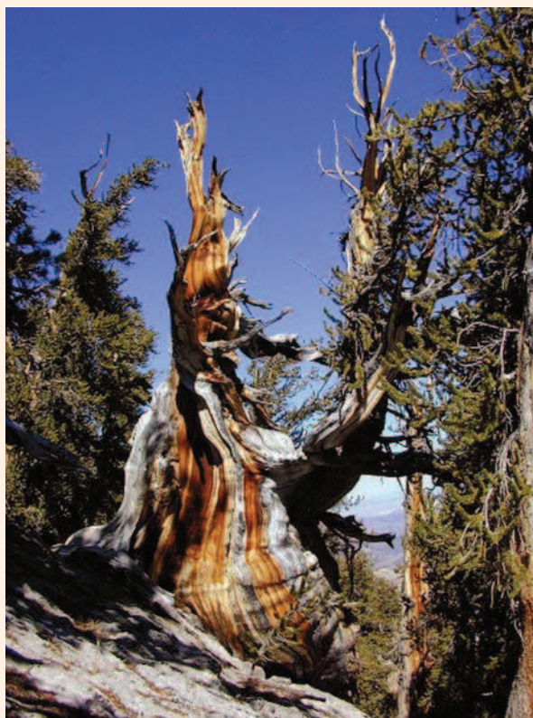
Figura 1. Exemplos de Pinus longaeva existentes no Estado americano da Califórnia, com aproximadamente 4.600 anos

O certo é que em árvores de regiões em que as estações do ano são bem diferenciadas a nitidez dos anéis de crescimento é evidente. Já em indivíduos que se desenvolvem em locais onde as condições