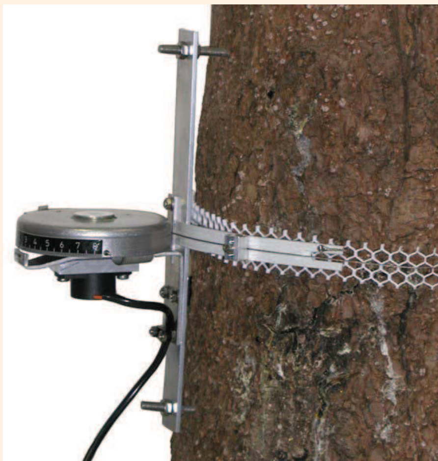
Figura 2. Ilustração de faixas dendrométricas instaladas em Araucaria angustifolia (Bertol.) Kuntze

Estimativas do crescimento por longos períodos de tempo em árvores tropicais podem ser feitas pela ►