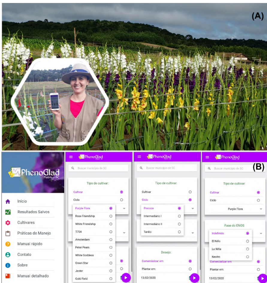
Figura 1. Área de gladiólios planejada com PhenoGlad Mobile SC (A) e interface do aplicativo (B). Autor: Leosane C. Bosco Figure 1. Gladiolus area planned with PhenoGlad Mobile SC (A) and interface of the App (B). Author: Leosane C. Bosco

motivador para o desenvolvimento do PhenoGlad Mobile SC. Esses aplicativos vêm sendo usados desde 2018 por extensionistas, produtores e escolas do campo para o planejamento do cultivo de gladiólio visando à diversificação de culturas e de renda de agricultores (UHLMANN et al., 2019). É a principal ferramenta de manejo do gladiólio no projeto Flores para Todos, uma iniciativa da extensão rural que visa levar a floricultura como uma alternativa de renda para agricultores familiares e manter o jovem no campo. Desde seu início em 2018 até final de 2019, alcançou 55 municípios nos estados da Região Sul do Brasil e beneficiou 67 famílias e 10 escolas do campo, com produção de 48 mil hastes florais de gladiólio.