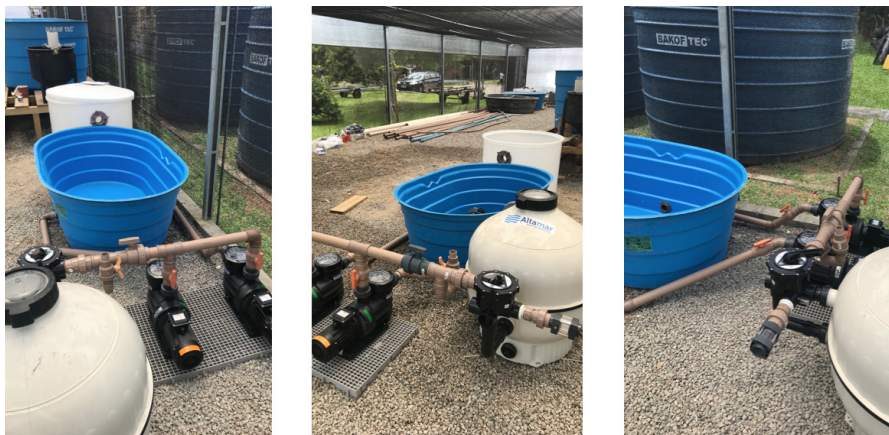
Figura 2. Instalação das unidades de tratamento de água. Figure 2. Water treatment units installation.

A aeração deverá ser montada através de uma rede central com divisórias apenas nos pontos finais. Segundo Timmons & Ebeling (2010) 1kg de ração consome 0,5kg de O 2 por dia. O sistema necessitará de 0,13kg de O 2 por linha, utilizando uma taxa de folga de 25%. Cada kW do soprador oferece cerca de 0,2kg de O 2 por dia, necessitando-se 2,67kWh ou 3,63cv no total. Portanto, foram utilizados 2 sopradores de 2cv cada. ▶