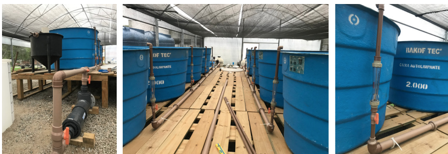
Figura 3. Detalhe do abastecimento de água.

Figure 3. Water supply detail.