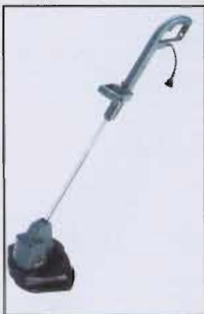
Cortador de grama ART 30 DF: novidade Bosch para jardins

Mais informações pelo site www.bosch.com.br/imprensa ou pelo fone: (019) 3232-0050, fax: (019) 3231-3314, e-mail: alfapress@alfapress.com.br .