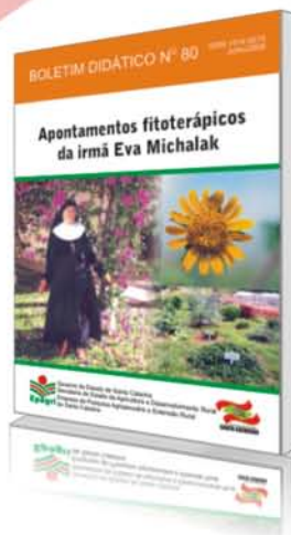
Boletim Didático N° 80 Apontamentos fitoterápicos da irmã Eva Michalak 94p. 2008 - R$ 10,00