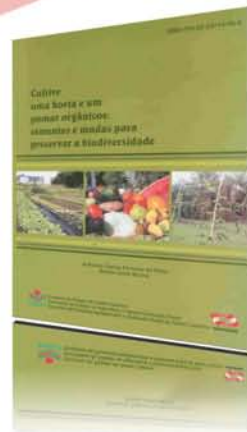
Livro Cultive uma horta e um pomar orgânicos: sementes e mudas para preservar a biodiversidade 312p. 2009 - R$ 30,00